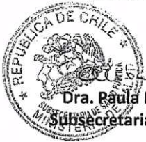
Dra. Paula Daza Narbona Subsecretaria de Salud Pública

Solicitamos a usted, dar la más amplia difusión a este documento tanto en los establecimientos de salud públicos como privados.